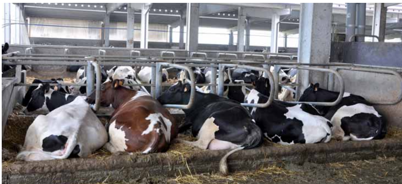
▼ La selezione genetica per la produzione di latte, e soprattutto di proteina e grasso, ha "premiato" alcuni ormoni e "penalizzato" alcuni altri.

Una delezione nelle cellule epatiche del gene che lo decodifica comporta una riduzione dell'IGF-1 circolante del 75%,