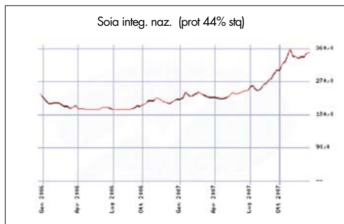
Quotazioni della soia nazionale nel corso del 2007