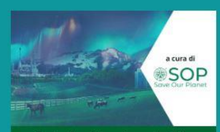
Agricoltura intensiva sostenibile

15 Ottobre 2020 | In evidenza, Neutralizzale