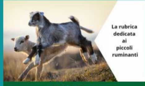
Ovis & Caprae

10 Settembre 2020 | Bufalantia, In primo piano