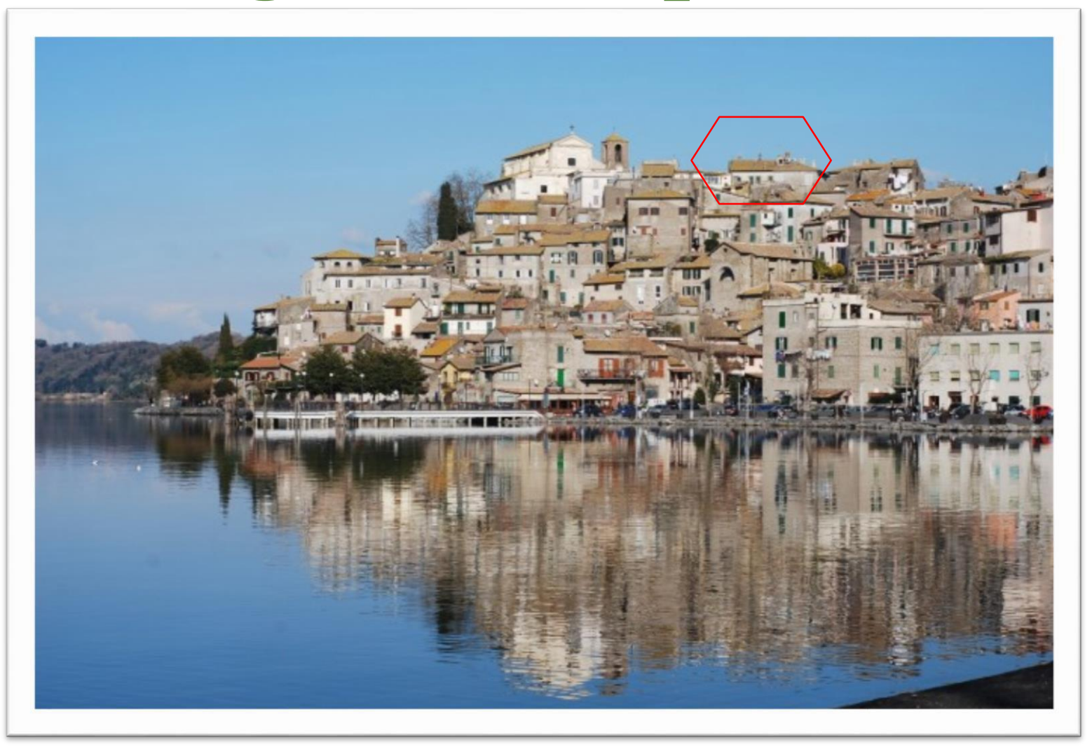
Via Roma 22, Anguillara Sabazia (Rome) - ITALY